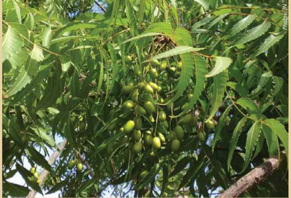
Magome, mbegu, majani na mizizi ya mwarobaini yanaweza kutumika kutengeneza dawa.

• Usitumie mti wa mwarobaini uliojitea tu ukiwa na lengo la kute-