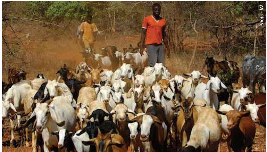
Ni muhimu kuzingatia utunzaji sahihi wa mbuzi na kondoo ikiwa ni pamoja na kuwapatia chanjo kwa muda muafaka ili kuepuka magonjwa.

macho na vidonda kwenye ulimi na kubanduka kwa ngozi ya juu.