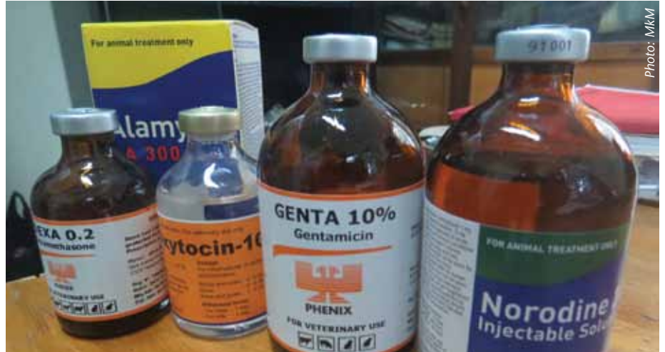
Hakikisha unafuata maelezo yanayotolewa kwenye kila dawa na ushauri wa wataalamu kuhusu matumizi ya mazao ya mifugo baada ya matumizi ya dawa.

Ni muhimu sana kwa wafugaji kuepuka kuuza maziwa yanayotokana na mnyama alietumia dawa kabla ya muda unaokubalika kumalizika. Hii ni kwa sababu baada ya dawa kufanya kazi, hutoka kwenye mwili wa