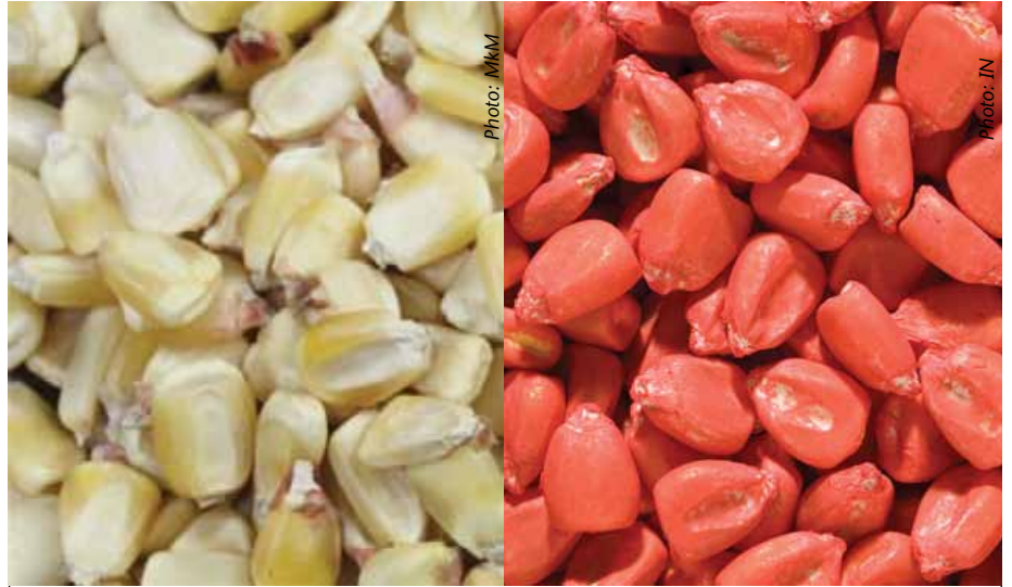
Ni muhimu kuchagua mbegu zilizozalishwa kitaalamu kulingania na mazingira uliyopo, na kufuata taratibu zinatakiwa kuepuka mbegu hizo kufa.