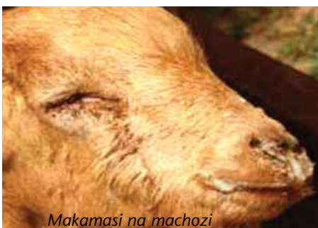
Makamasi na machozi